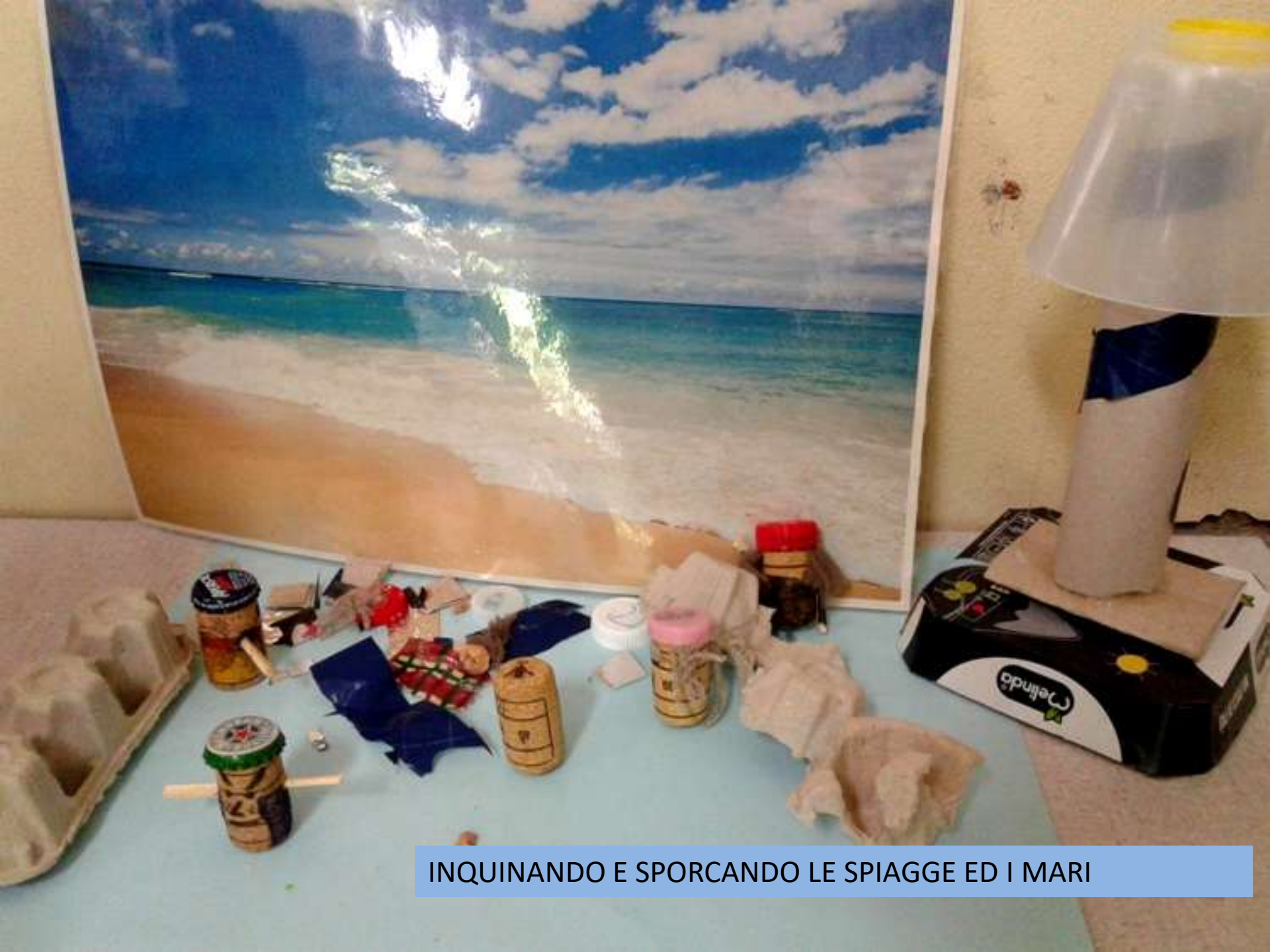
INQUINANDO E SPORCANDO LE SPIAGGE ED I MARI