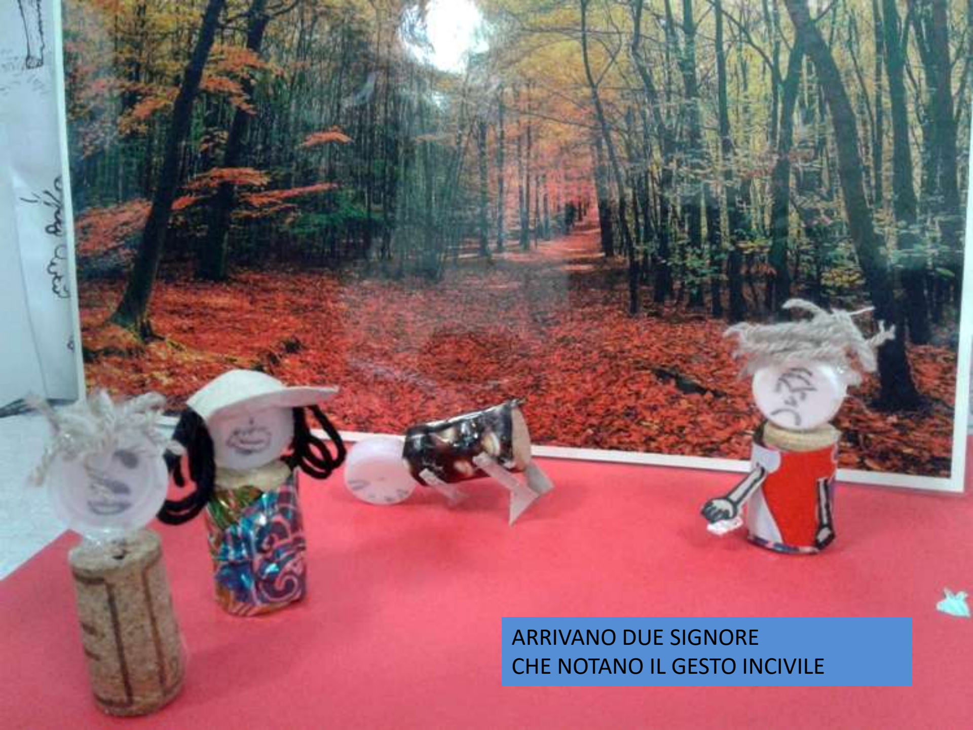
ARRIVANO DUE SIGNORE CHE NOTANO IL GESTO INCIVILE