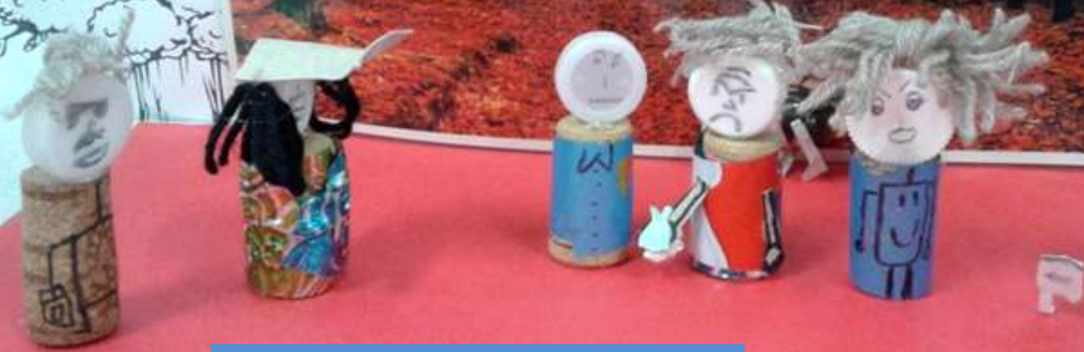
ARRIVANO ANCHE DUE POLIZIOTTI